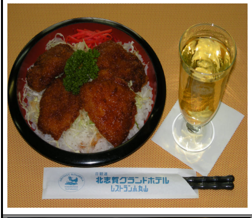
ソースカツ丼 (キャベツ・紅しょうが) ジュース