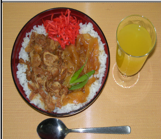
スタミナ丼 (紅しょうが) ジュース