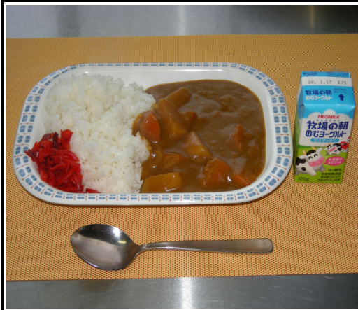
カレーライス(福神漬) 飲むヨーグルト