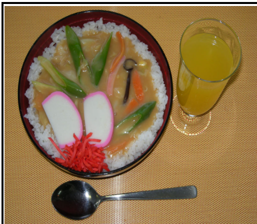
中華丼 (紅しょうが) ジュース