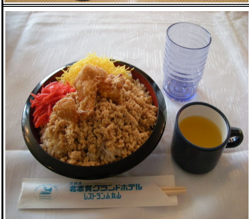
そぼろごはん (鳥そぼろ・唐揚げ・錦糸卵・紅しょうが) ゼリー