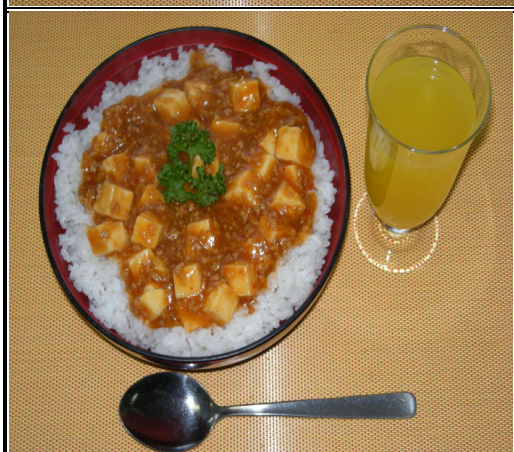
マーボー丼 ジュース