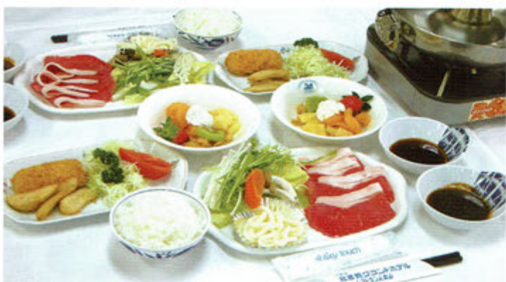
▲夕食一例(イメージ)