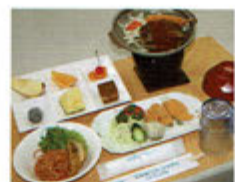
▲夕食一例(イメージ)