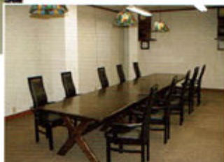
▲ミーティングルーム