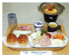
▲朝食一例(イメージ)