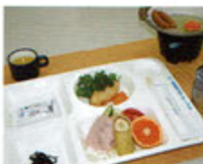
▲朝食一例(イメージ)